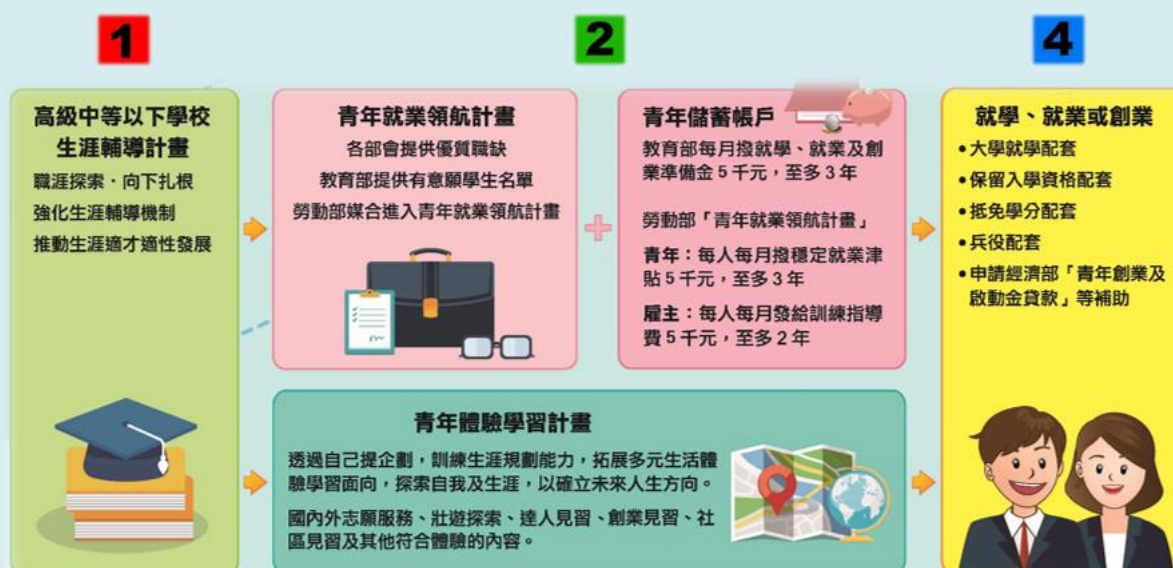
青年教育與就業儲蓄帳戶方案架構圖